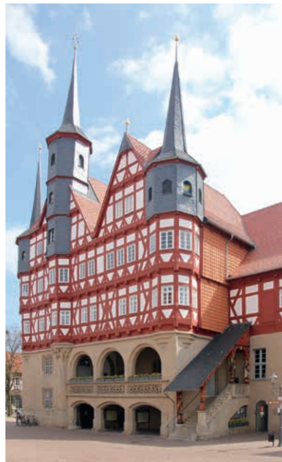
Fachwerkjuwel Rathaus Duderstadt

Mit vier Veranstaltungen wird die Volksbank Mitte eG zu einem abwechslungsreichen Programm beitragen. Für das Festival gibt es Dauerkarten, die im Vorverkauf für