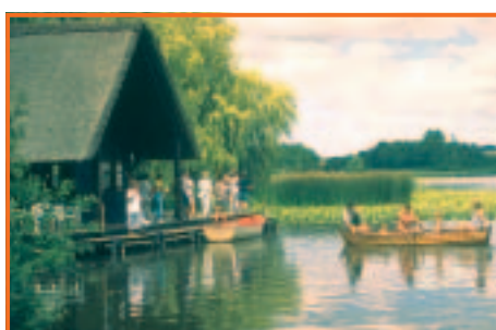
Idylle am Seeburger See

Puren Badegenuss in freier Natur bieten vor allem der Seeburger See bei Duderstadt und die Seen der Northeimer Seenplatte . Daneben gibt es an beiden Standorten ein breites Angebot zur Freizeitgestaltung für die ganze Familie. Dem naturverbunden Besucher bieten sich eindrucksvolle Einblicke in eine phantastische heimische Tier- und Pflanzenwelt.