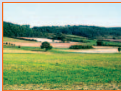
An der Weper bei Moringen